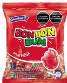
Rojo Fresa x12un