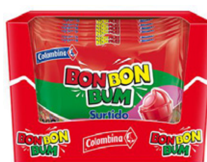
Surtido x 120un