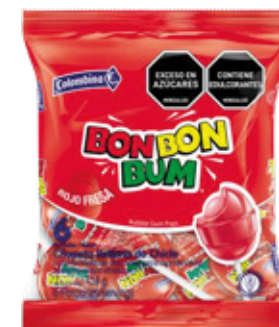
Rojo Fresa x6un